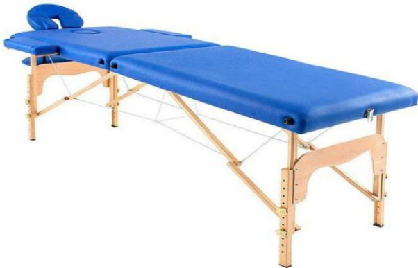
Table pliante EASY de 182 x 60 cm en bois de grande légèreté pour son transport en consultations externes.

Doté d'un panneau Reiki, réglable en hauteur dans différentes positions et revêtement similicuir.